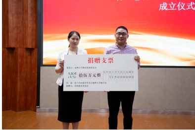
2019 年 5 月 29 日 青山慈善基金会向温州大学 教育发展基金会捐赠 15 万元